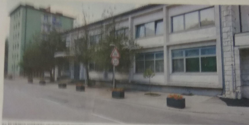
Da bi občina pridobila pločnik na Bazoviški cesti, je pripravljena razlastiti banko Intesa Sanpaolo in ministrstvo za javno upravo, ki sta na njem vzpostavila etažno lastnino.

SEŽANA · Občina bi razlastila ministrstvo za javno upravo in banko Intesa Sanpaolo