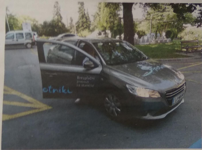
Sopotniki niso prepoznavni le po avtomobilih z napisi, ampak tudi po zanesljivosti. V zdravstvenih ustanovah jim zaupajo in njihove potnike naročajo ob urah, ko lažje uskladijo vožnje.

Projekt Primorskih novic Medgeneracijski most nastaja v sodelovanju Ministrstva RS za kulturo.