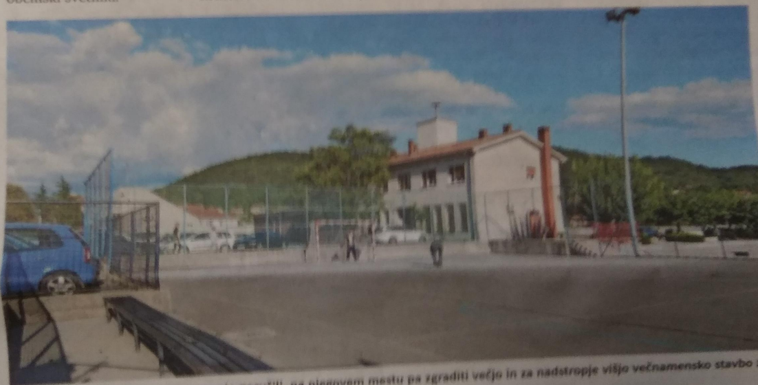
Star gasilski dom v Sežani nameravajo porušiti, na njegovem mestu pa zgraditi večjo in za nadstropje višjo večnamensko stavbo z glasbeno šolo in druge družbene dejavnosti.

Njihovo število naj bi se tako skupaj povečalo na 206, od tega bo 12 parkirišč namenjenih za invalide. Trenutno je ob starem gasilskem domu 84 parkirišč. *