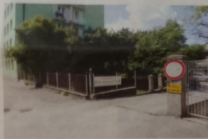
Nov uvoz do parkirišča za lekarno bi občina uredila po zemljišču na Bazoviški cesti ob zelenem bloku nasproti ljudske univerze.

Lastnica zemljišča, po katerem naj bi speljali dovoz do parkirišča, je banka Intesa Sanpaolo. Prav tako je tudi delna lastnica zemljišča s pločnikom, kjer je solastnica še država oziroma ministrstvo za javno upravo. "Že dalj časa smo se dogovarjali z banko o pridobitvi lastniške oziroma druge stvarno-pravne pravice na obeh zemljiščih, prav tako tudi z ministrstvom. Žal se, predvsem z banko, nismo uspeli dogovoriti," pravijo na občini.