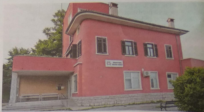
Ambulanta v Komnu je zelo obremenjena, zdravnica je priljubljena, a dodatne pomoči nova direktorica ni obljubila, saj zdravniki manjkajo tudi v ambulantah v drugih občinah.