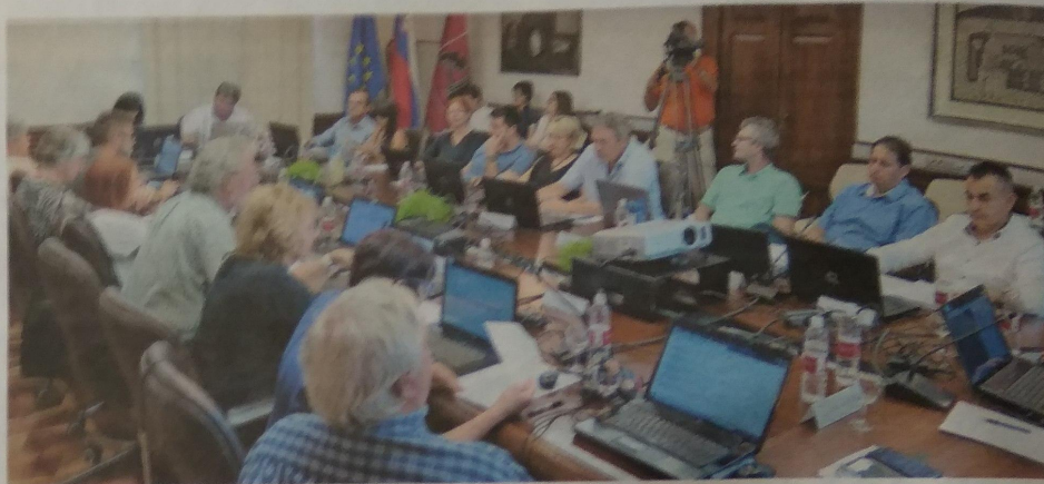
Na zadnji seji so se sežanski občinski svetniki seznanili z osnutkom reorganizacije krajevnih skupnosti v občini. Vendar pa nobeni krajevni skupnosti ne bodo omogočili ustanovitve še v tem mandatu.