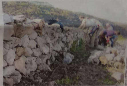
Sežanska občina je v svojem proračunu namenila 40.000 evrov za sofinanciranje obnove suhih zidov, materiala in izobraževanja.

Možnost za prijavo je do 30. oktobra. Ker bodo vloge odpirali vsak mesec, do porabe 40.000 evrov, kolikor je za sofinanciranje obnove materiala in izobraževanja predvideno v letošnjem proračunu, na