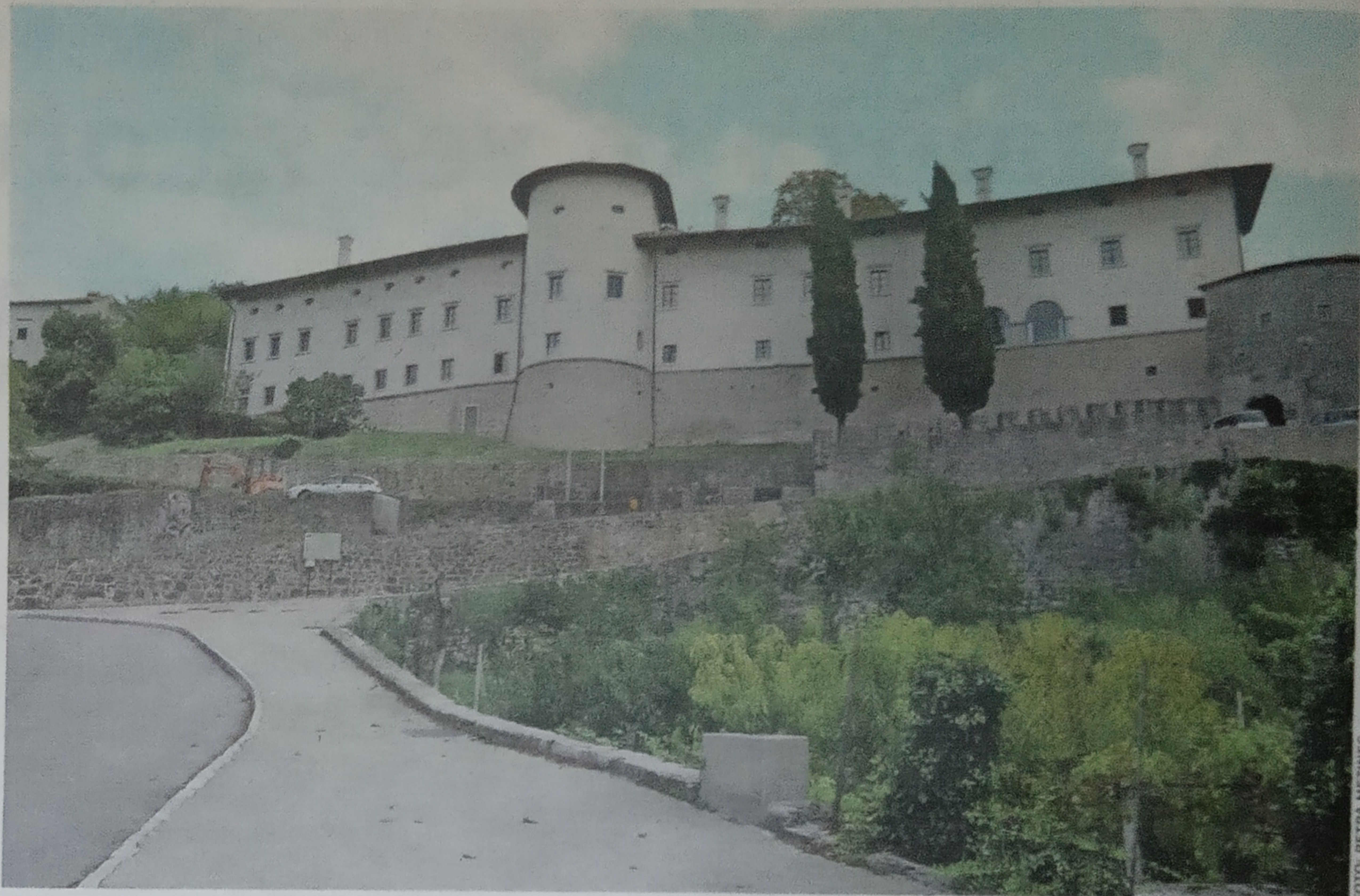
Delo Javnega zavoda Komenski Kras, ki je pomembno prispeval k turistični oživitvi Štanjela, bo nadaljevala Razvojna destinacijska organizacija Krasa in Brkinov.

Lanska nujna obnova škofeljskega mostu in dvig plač v javnem sektorju bosta imela posledice v divaškem proračunu tudi v letu 2020.