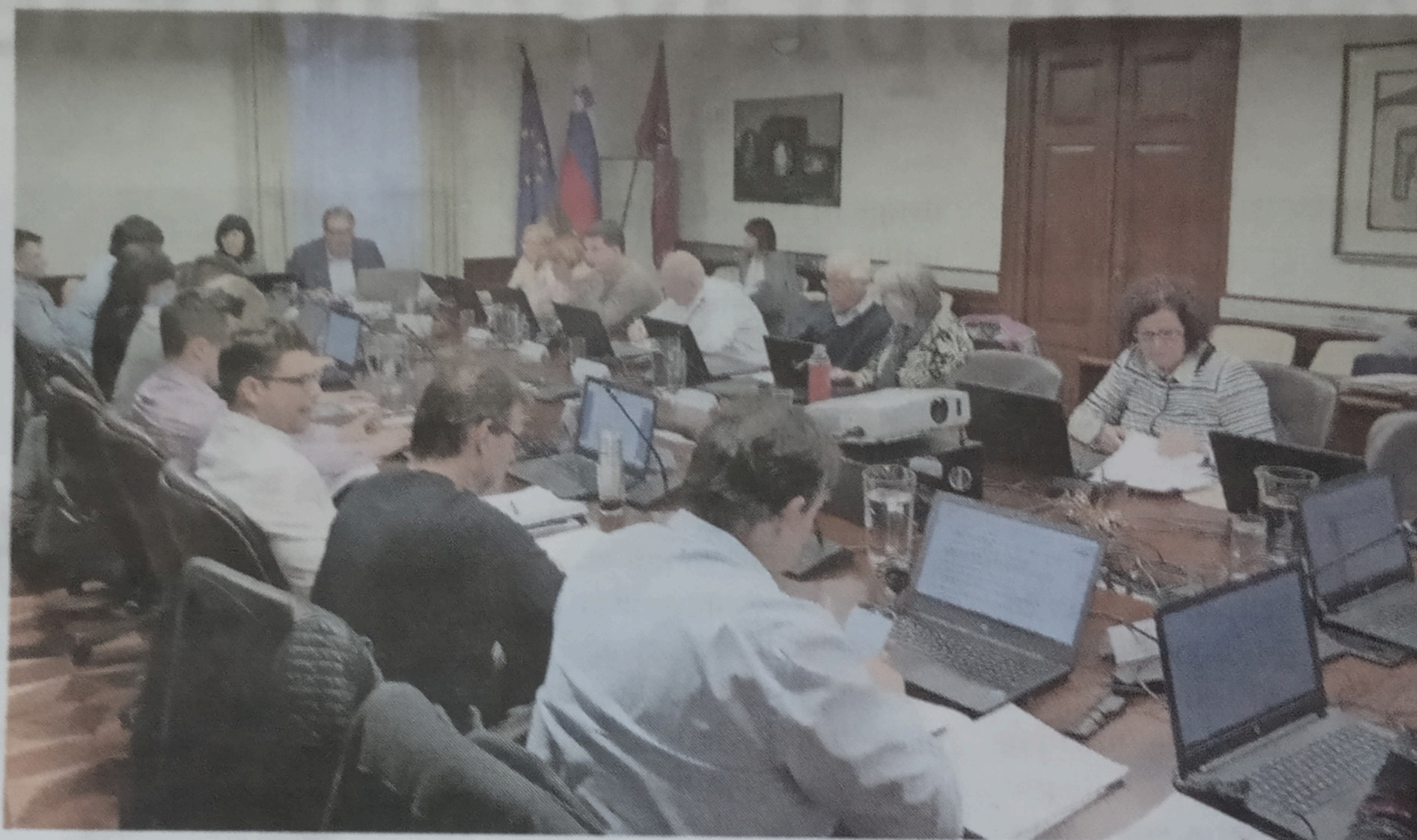
Na zadnji občinski seji so svetniki predlagali video snemanje občinskih sej.

V občinah Ilirska Bistrica in Postojna je snemanje in predvajanje sej po televiziji ustaljena praksa, prav tako v pivški občini. V občinah Komen, Divača in Hrpelje-Kozina pa, tako kot v Sežani, posnamejo zvočni posnetek, ki služi predvsem za pripravo zapisnika.