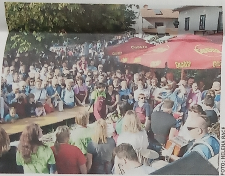
Rodiški kostanjev praznik je ena večjih prireditev v občini, ki pritegne številne obiskovalce od blizu in od daleč.