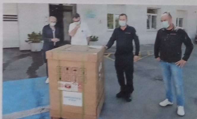
Direktorica in strokovni vodja sežanske bolnišnice sta se v petek zelo razveselila predstavnikov regijskega štaba CZ, ki sta pripeljala zanesljiv respirator.