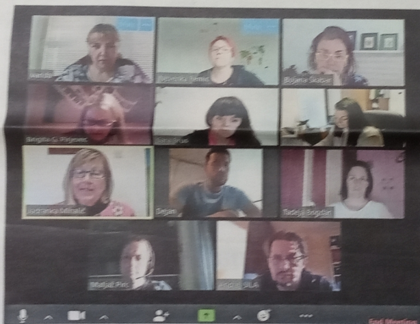
Svet sežanske šole je sejo opravil kar prek videokonference.