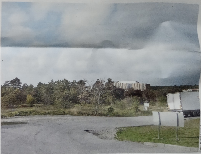
Družba Log Center A namerava na dobrih 30 hektarjih južno od hotela Safir (v ozadju) zgraditi tri večje objekte, ki bodo namenjeni logističnim storitvam.